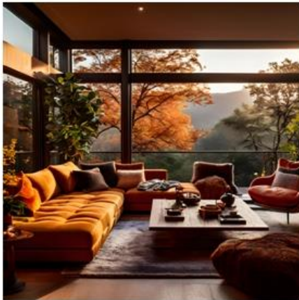
"A living room, warm colors"