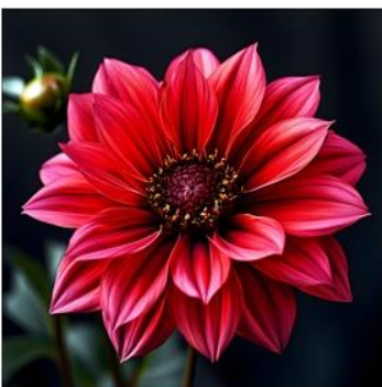
"A realistic flower"