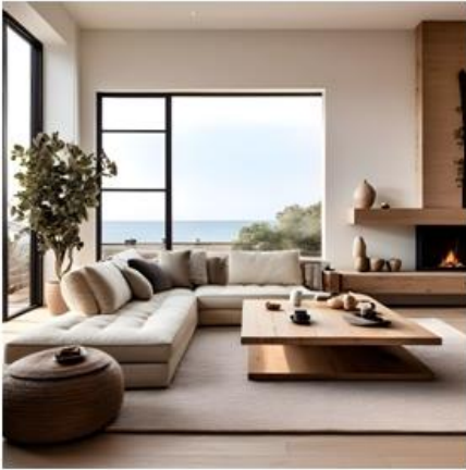
"A living room"