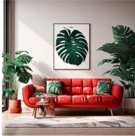
"A living room with a red couch and monstera plants"